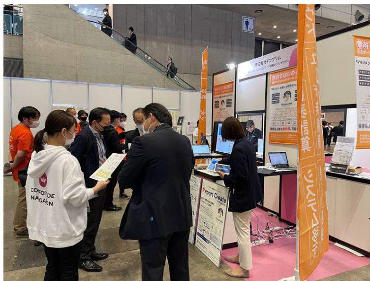
CEATEC 2022にて、展示会の様子

幕張メッセで開催されたCEATEC 2022において、2022年10月20～21日に株式会社インプリムのブースで、プリザンターの実績紹介の他、プリザンターとEXGATEを組み合わせた” i-DX ECO 安否確認サービス”を、デモを交えながら紹介いたしました。